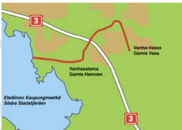
Gamla Vasa kanal.

Kuriosa: Vasas borgerskap arrenderade Smulterö till priset av 1,5 tunna salt årligen.