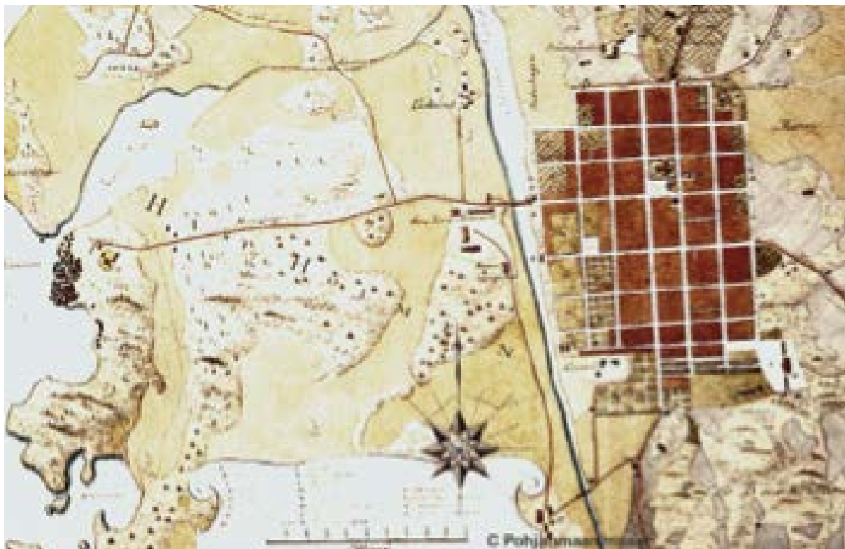
Karta över Vasa från ungefär år 1802.