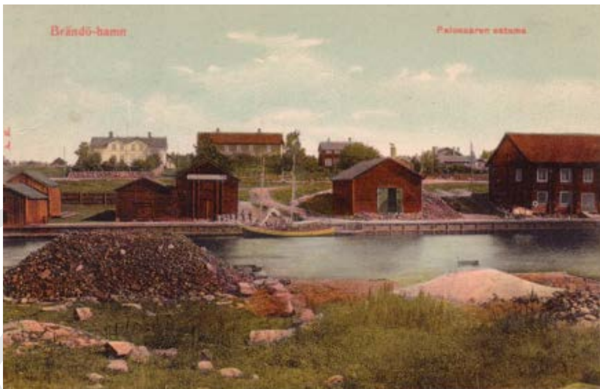
Brändö hamn ca 1907.