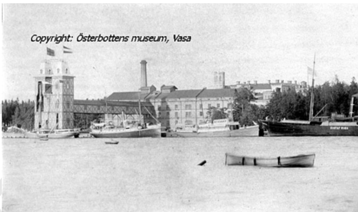
Inre hamnen troligtvis från 1890-talet med bl.a s/s Gustaf Wasa, bild från Österbottens museum. Kaj Höglund.