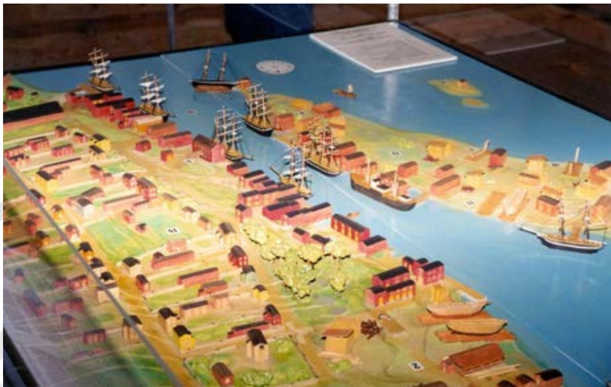
Brändösund på 1860-talet. Modellbyggare Lauri Hyppönen, Vasa sjömuseum.

Både Inre hamnen och Brändö hamn blev med tiden för trånga och grunda även de, på grund av landhöjningen och de allt större fartygen. För att tillfredsställa det ökande handelsbehovet påbörjades år 1890 planeringen av en ny djuphamn i Vasklot. En vägbank byggdes över Stadsfjärden och ett järnvägsspår drogs. Kostnaden blev över 1 miljon mark, och 1893 var den nya hamnen färdig att tas i bruk. Utehamnen flyttades från Brändö till Vasklot, men Inre hamnen användes dock parallellt med Vasklot