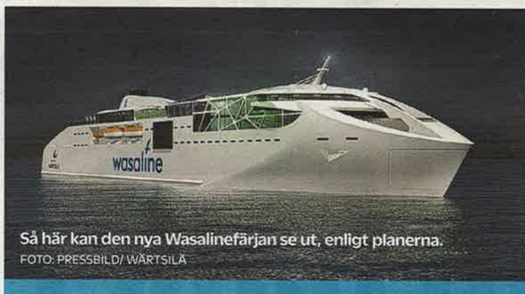
Så här kan den nya Wasalinefärjan se ut, enligt planerna.

Offentliga dokument kring måndagens beslut kan inte heller förklara varför man kan gå in för 70 miljoner euro i lån. Konsultbolaget Inspira som står för siffrorna skriver att NLC Ferrys omsättning räcker till