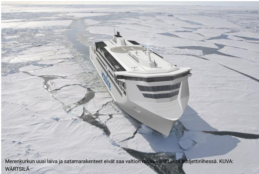
Merenkurkun uusi laiva ja satamarakenteet eivät saa valtion rahaa vielä tässä budjettiriihessä.

Hallitus ei lupaa Vaasalle vielä 25 miljoonan euron laivarahapottia.