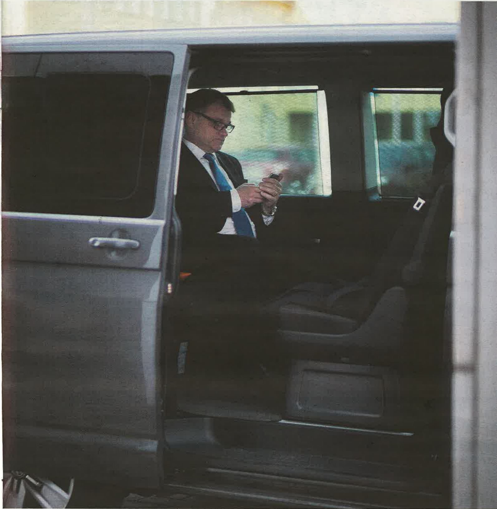
na. Sipilä soitteli hallituskumppaneilleen ja vastaili toimittajille.