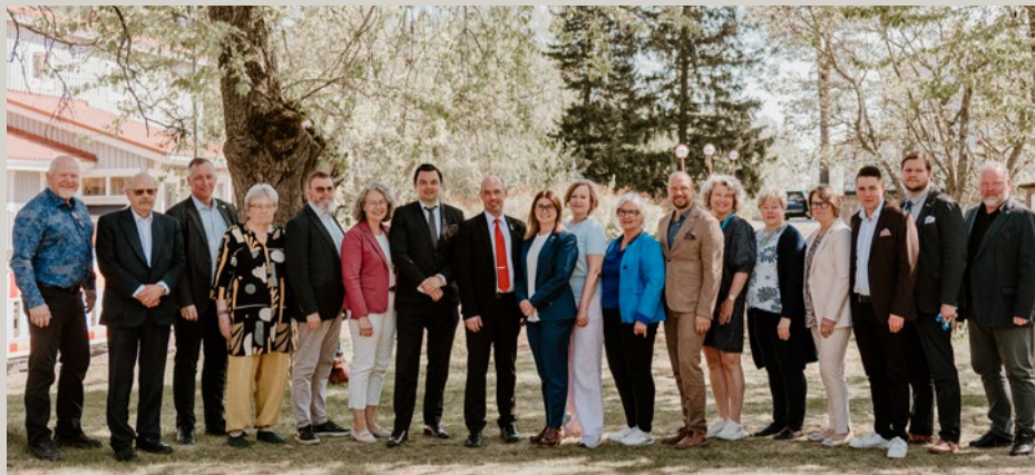
Kvarkenrådets styrelse på årsmötet i Karleby.

Kvarkenrådet arrangerade tillsammans med Finsk-svenska handelskammaren ett seminarium med tillhörande diskussioner