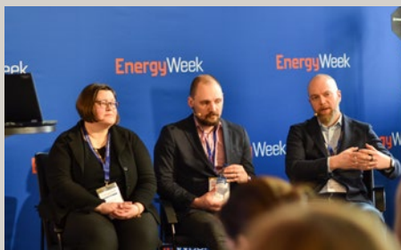
Bothnia Green Energy-projektets seminarium under EnergyWeek.

Bothnia Green Energy-projektet (BGE) ordnade ett seminarium 13.3.2024 under EnergyWeek om energilösningar i byggnader.