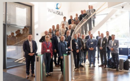
Kvarkenrådets studiebesök för Trafikledsverkets arbetsgrupp i Umeå och Vasa.

Trafikledsverket i Finland (Väylä) ansvarar för studien med Kvarken Fixed Connection Feasibility Study, en omfattande utredning som undersöker den fasta förbindelsens tekniska, miljömässiga och ekonomiska förutsättningar. Kvarkenrådet, som ingår i studiens styrgrupp, bidrar med ett gränsregionalt perspektiv för att säkerställa att den planerade förbindelsen anpassas efter både lokala och nationella behov i Finland och Sverige.