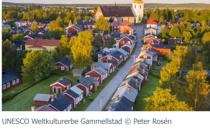
UNESCO Weltkulturerbe Gammelstad

Mit der Wasaline reist man komfortabel und klimafreundlich zwischen Umeå (SWE) und Vaasa (FIN). Die Fähre ist das erste CO 2 -neutrale Passagierschiff der Ostsee und verbindet die beiden dynamischen Zwillingsstädte bereits seit den 1940er Jahren.