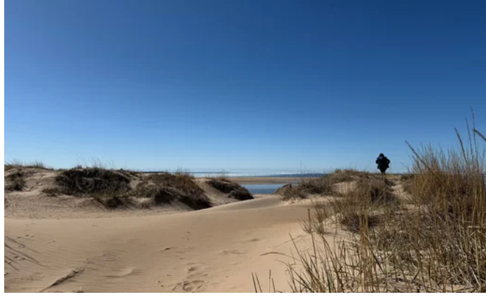
Der Strand von Kalajoki

Natur, Kultur und Nachhaltigkeit vereint auf einer einzigartigen Küstenroute