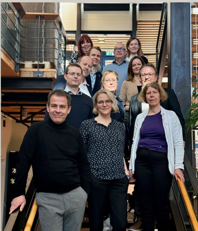
I projektet Unicollab träffades svenska och finländska universitet och högskolor för att undersöka samarbetsmöjligheter.