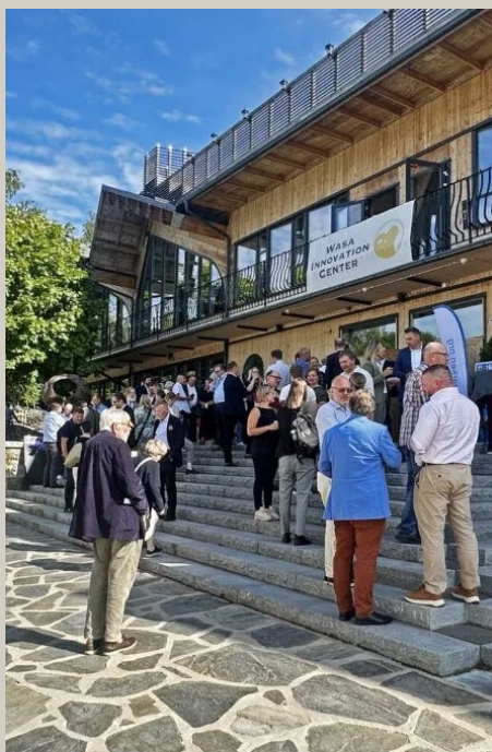
Wasa Future Festival 14.8.2025