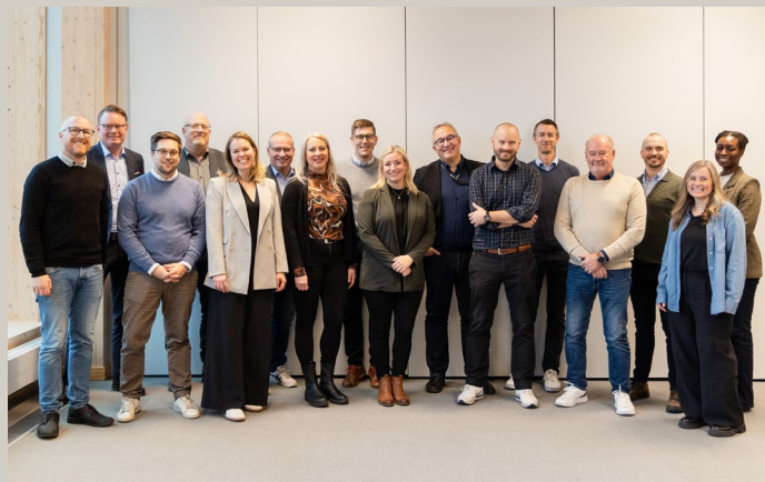
FAIR 2 projektaktörernas workshop i Skellefteå, 9–10 oktober 2024

Kartlägger efterfrågan på hållbart gränsöverskridande regionalflyg