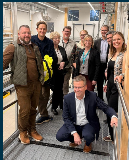
Beredningsgruppen för energi gjorde studiebesök hos RISE 22.10.2025.