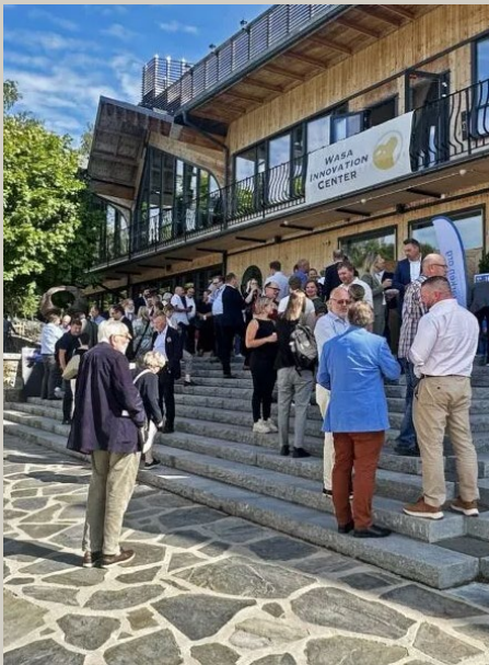
Wasa Future Festival 14.8.2025