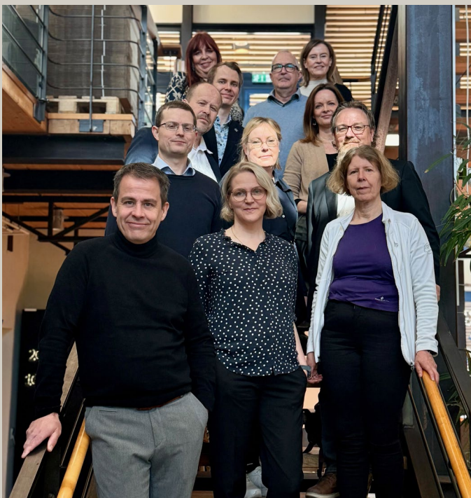
Unicollab-hankkeessa ruotsalaiset ja suomalaiset yliopistot ja korkeakoulut tapasivat selvittääkseen yhteistyömahdollisuuksia.