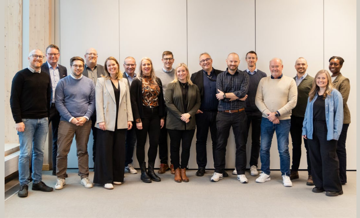
FAIR 2 -hanketoimijoiden työpaja Skellefteåssa, 9.–10. lokakuuta 2024.

Kestävän rajat ylittävän alueentoliikenteen kysynnän kartoittaminen